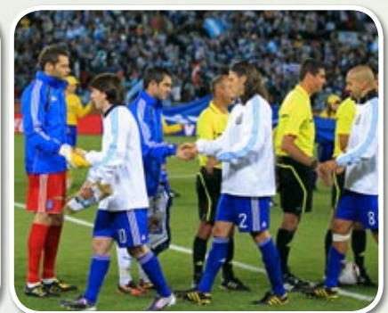
Die Profis machen es vor: Das Abklatschen ist Zeichen der respektvollen Begegnung